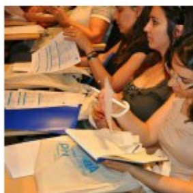
Casa cheia para mobilidade