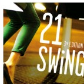
Baloços para gente grande