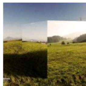
Eras capaz de dormir rodeado de leões?