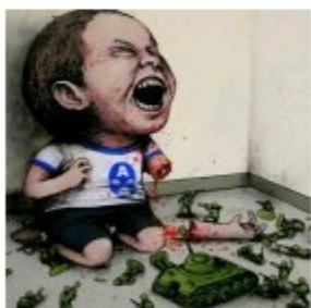
Street art com muito humor negro